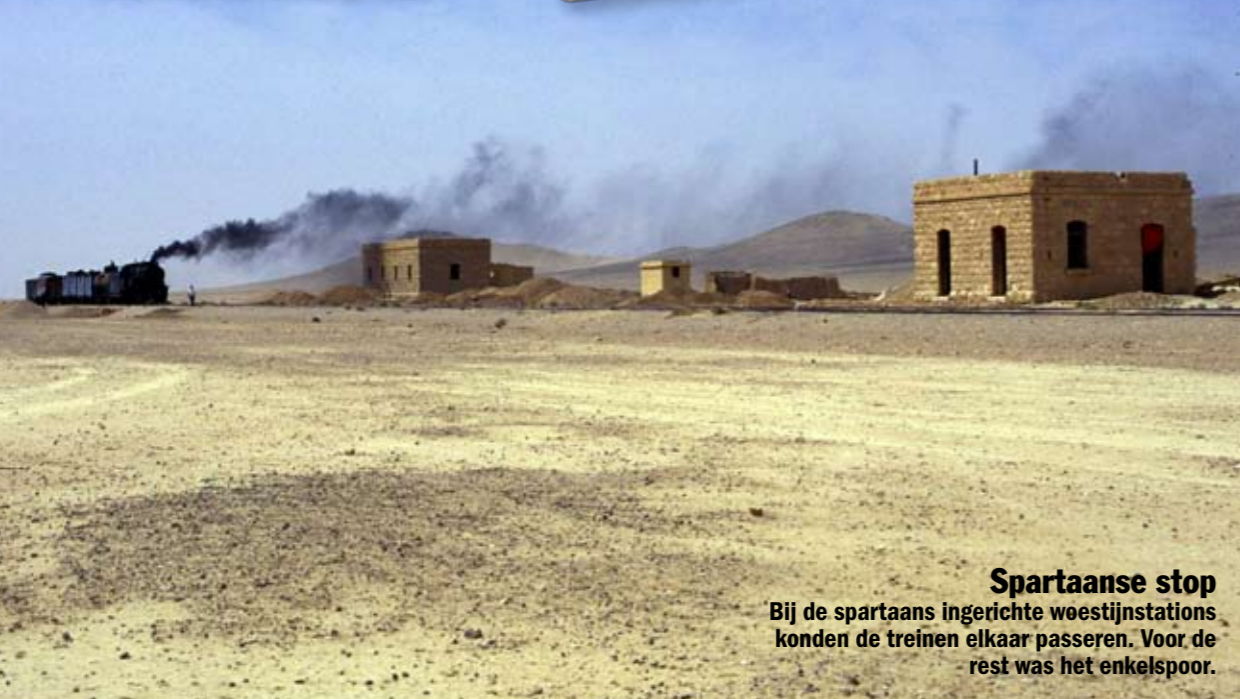
Spartaanse stop Bij de spartaans ingerichte woestijnstations konden de treinen elkaar passeren. Voor de rest was het enkelspoor.

De locomotieven op de Hijzaspoorweg kwamen allemaal uit Europa. Voor de wagons gold hetzelfde. De moskeewagen (getooid met een kleine minaret) werd wel in het Ottomaanse Rijk gemaakt.