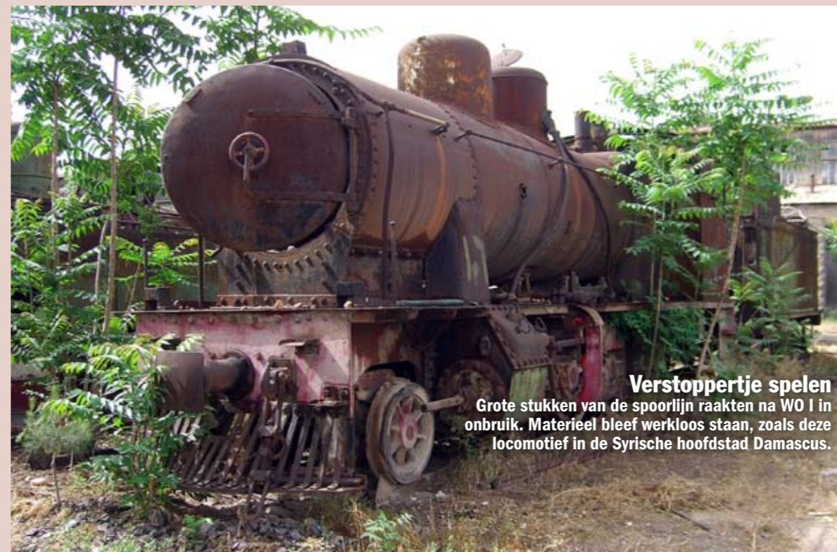
Verstopperje spelen Grote stukken van de spoorlijn raakten na WO I in onbruik. Materieel bleef werkloos staan, zoals deze locomotief in de Syrische hoofdstad Damascus.