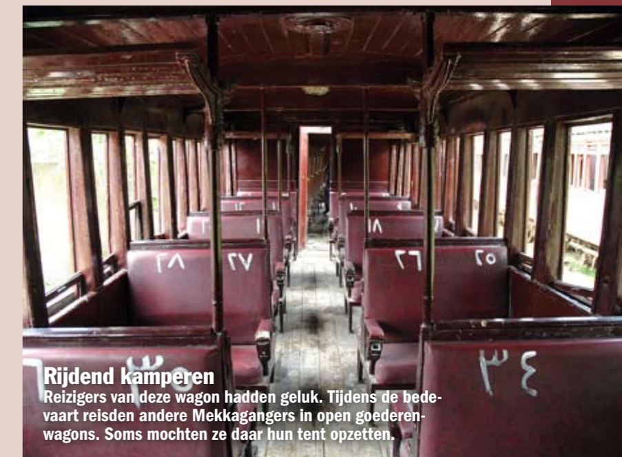
Rijdend kamperen Reizigers van deze wagon hadden geluk. Tijdens de bedevaart reisden andere Mekka'gangers in open goederenwagons. Soms mochten ze daar hun tent opzetten.

De spoorlijn volgt een oude pelgrimsroute. Omdat de kamelen van de pelgrims niet goed door bergachtig gebied lopen, zijn deze routes vrij vlak. Daardoor hoefden de spoorbouwers niet veel tunnels en bruggen te bouwen.