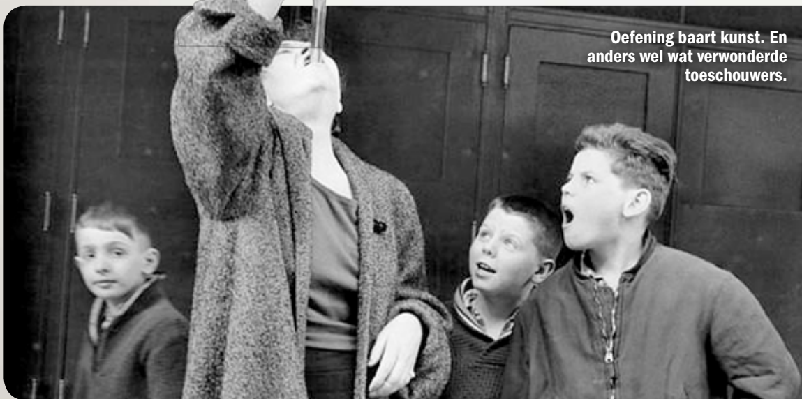
Oefening baart kunst. En anders wel wat verwonderde toeschouwers.

Je bent zelf degenliker en hebt behoefte om met gelijkgestemden over je vak te praten? Sluit je dan aan bij de Sword Swallowers Association International. De vereniging stelt een paar eisen. Zo moet je een zwaard kunnen slikken dat a) niet oprolbaar of inschuifbaar is, b) minstens 38 centimeter lang is, en c) minstens 2 centimeter breed is. Eitje? Meld je dan aan op www.swordswallow.org ! Voor de kosten hoeft je het niet te laten: slechts 25 dollar per jaar. Nederlandse leden heeft de club overigens niet. Zijn Nederlanders niet zulke waaghalzen, waar het de slokdarm betreft?